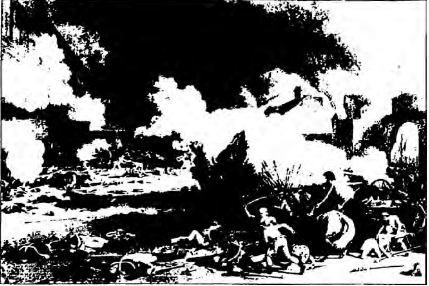
Joseph de Maistre'e göre Fransız Devrimi, en başta krala ve dine karşı ilki büyük suç işlemiştir. Edmund Burke ise devrimin, toplumun kazanmış olduğu maddi ve manevi değerleri tahrip ettiği inancında olup, rüthe ve mülkiyet hiyerarşisini yok ettiğini öne sürüyordu. Devrim sırasındaki çatışmaları tasvir eden bir çizim.

ye, eğitim sisteminin hükümetin eline verilmesine ve ölçülerin standartlaştırılmasına ilişkin gelişmeler muhafazakârların tepkisini çekmiştir. Muhafazakârlara göre düşünsel ve ahlâki eğitim din ve aileden ayrılamaz, devlet olsa olsa teknik öğretimi üstlenebilir. Restorasyon döneminde Fransız Devrimi'nin getirdiği bu önemli değişikliklerin bazılarında eskiye dönüş eğilimi yaşansa, monarşi ve aristokrasinin ağırlığı ve kilisenin nüfuzu yeniden tesis edilse de, devrim öncesiyle sonrasının aynı olduğunu kimse söyleyemez.