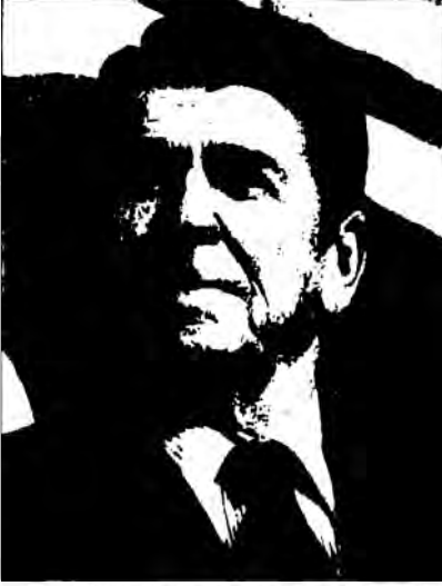
Ronald Reagan (1911-2004) radyo spikerliği ve sinema oyunculuğu yaptı. ABD başkanlığı döneminde vergileri düşürürken askeri harcamaları da arttıran Reagan büyük askerî girişimlerin yanısıra bazı ülkelerde darbeler düzenledi.

Batı dünyasının gelişmiş kapitalist ülkelerinde 1970'lerin sonlarında ve özellikle de 1980'lerde ABD Başkanı Ronald Reagan ve dönemin İngiltere Başbakanı Margaret Thatcher'ın temsil ettiği bir başka tür "yeni-muhafazakârlık" akımı gelişti. Federal Almanya'da da sosyal demokratların uzun yıllar süren iktidarının ardından muhafazakâr Hıristiyan Demokratlara bir geçiş yaşandı; Başbakan Helmut Kohl liderliğinde iki Almanya'nın birleşmesi muhafazakârların büyük zaferi olarak algılandı. Bu dönem, muhafazakârlar açısından, 1970'lerin krizlerinden çıkışı ekonomik alanda neo-liberal siyasal açılımlar eşliğinde, yeniden düzenleme ve özelleştirmelerle birlikte öngören bir siyasal açılım dönemi oldu. Elde edilen