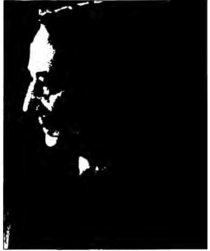
İngiliz muhafazakâr siyaset bilimci Michael Oakeshott'a (1901-1990) göre toplumdaki sivil beraberlik (civil association) kavramının, otoriter bir düzeni değil, demokratik kuralları içeren ilişkilere dayanan bir düzeni sağlaması gerekir.

20. yüzyıl muhafazakârlığı siyasal amaçlarına ulaşmış, bu anlamda mevcut düzenin sürmesinde çıkarı olan liberal imalatçı ve sanayici kesim ile diğer profesyonel grupların savunduğu bir siyasal çizgi haline gelmiştir. Bu anlamda artık korunan, modern üretim ilişkileri olurken, düzen, ona eleştiri yönelten, mevcut düzenden çıkarı olmayan