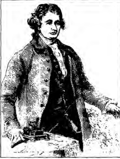
Edmund Burke (1729-1797) Dublin'de doğdu. Trinity College'de ve Londra'da hukuk okudu. Avam Kamarası'na da giren Burke, krallın yetkilerinin kısıtlanması üzerine çalışmalar yaparken reformcu atımlara destek vermedi.

zakârlık, Aydınlanma'nın liberal felsefi düşünme tarzına, doğal haklar/doğal hukuk düşüncesine ve burjuva devrimci düşünce ve davranış biçimlerine karşıdır. Aydınlanmanın "tarihe doğa yasalarının egemen olduğu" yolundaki tezini reddeder. İnsanın davranışlarını eşyanın hareketinden ayırmak gerekir. İnsanın maddi gerçekliği, biyolojik organizması onu doğaya bağlar. Ancak insanın tarihi doğaya rağmen, ondan farklı gelişir, bu da insanın biyolojik gerçekliği üzerinde yer alan ruhuna bağlıdır. Muhafazakârlar Aydınlanmanın "soyut" aklına da, deneyle doldurulacak bir tabula rasa olarak düşünülen akla da karşıdırlar. "Tarihsel farklılıkların, tarihsel bağlamından ve dolayısıyla ahlâki sorumluluklarından soyutlanmış tek bir aklın potasında eritilmek istenmesine tepki duyarlar." 6