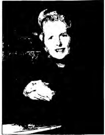
'Demir Lady' olarak ünlenen Margaret Thatcher (1925-), başbakanlığında devletin ekonomiye müdahalesine son vererek kamu harcamalarını kısıtlayan monetarist siyasetle, enflasyonu düşürmek istedi ama işsizliğin artmasını önleyemedi.

1990'ların başlarında, Sovyetler Birliği'nin yıkılışının ardından muhafazakârlığın farklı yönleri belirgin hale geldi. Bu farklılaşmada en önemli iki kanal "geleneksel" ve "bireyci" muhafazakârlık oldu. Geleneksel muhafazakârlık klasik kültürel muhafazakârlık ile, Bur-