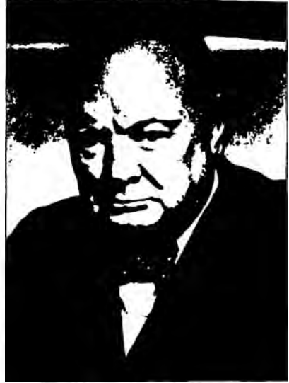
Muhafazakâr siyasetin 20. yüzyıldaki en önemli temsilcisi Sir Winston Churchill (1874-1965), muhafazakâr düşünce içinde sürekli geçmişle yaşayan ve bunu uyguladığı siyasetin araçlarına da yansıtan bir siyasetçiydi.

Muhafazakâr tarih felsefesine göre, modern tarih ilerleme değil, gerileme sinyalleri vermektedir. Bu gerileme oldukça eskilere dayanır: Rönesans, Reform ve akıl çağı gerilemenin adımlarını oluşturur. Devrim ise, Batı Avrupa’da Ortaçağ sonlarından başlayan düzen bozucu adımların trajik bir sonucu olarak görülür. Bu bakış açısına göre Ortaçağ organik bir toplum yapısı içermektedir. Sonra aile, cemaat, sınıf ve kutsal olan her şeyin altüst olmasına, toplum yapısının kargaşa içinde darmadağın hale gelmesine, ahlâki değerlerin ortadan kalkması-