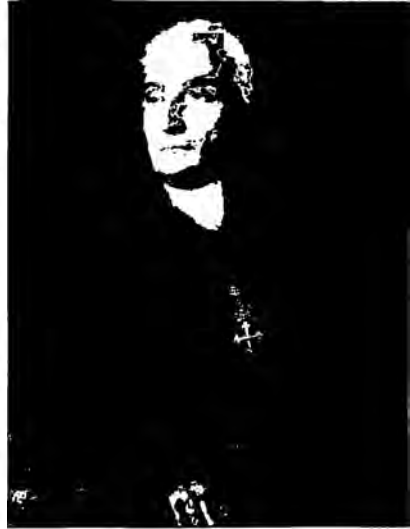
Tarih felsefesinde akıl yerine imanı ve sezgiyi öne çıkarp, "İlahi adalet"i savunan Joseph de Maistre (1753-1821), Torino'da hukuk öğrenimi gördü. Koyu bir Katolisizmi savunduğu ve Fransız Devrimi'ne karşı çıktığı için sürgüne gönderildi.

Muhafazakâr düşüncenin kendini oluşturduğu dönemde Burke ve Joseph de Maistre gibi ilk temsilciler muhafazakâr kelimesini hiç kullanmadılar, ancak daha sonra Tocqueville gibi düşünürleri derinden etkileyen çerçeveyi oluşturdu. Muhafazakârlara göre siyasetin kendinden bir devlet işleyişi tekniği çıkartılabilecek bilimi, evrensel ölçekte uygulanabilecek siyasal bir ideal ya da soyut insan hakları bütünü yoktur. 11 Bu yüzden muhafazakârlar önce Fransız Devrimi'nin taçlandığı yasalar önünde eşitlik ve yurttaş haklarına tepki duydu, sonra 19. yüzyıl sonlarından İkinci Dünya Savaşı öncesine uzanan ve genel oy hakkı ile sembolize edilen demokrasi zemininin genişlemesine karşı çıktı, daha sonra da refah devleti uygulamalarına itiraz etti.