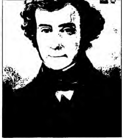
Muhafazakâr bir cumhuriyetçi, tarihçi ve siyaset insanı Alexis de Tocqueville'in (1805-1859) toplum ve felsefe üzerine oluşturduğu düşünceler kendisinden sonra da ele alınarak, siyaset biliminde yeni tartışmalara yol açmıştır.

Kitle toplumu ve kitle düşüncesi 19. yüzyılda gelişmiş ve yaygınlaşmıştır. Demokrasinin en önemli tehlikesi, her ne kadar çoğunluktan, eşitlikçi değerlerden söz edilse de, "kitle"nin ortaya çıkması olmuştur. Bu düşünceye göre kitle toplumu insanı sosyallikten uzaklaştırır. Daha sonraki dönemde, özellikle 20. yüzyılda yeni insanın yara-