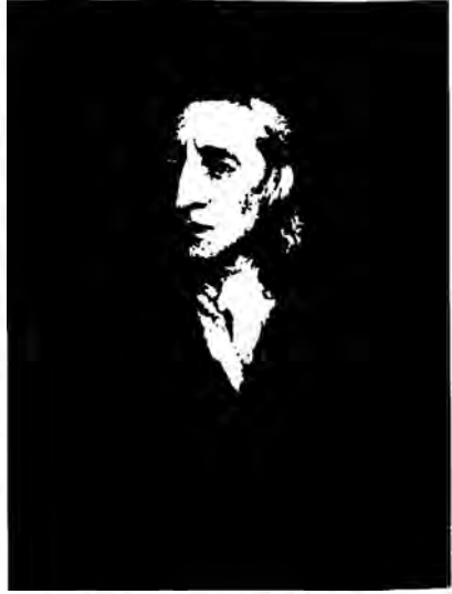
John Locke (1632-1704), düşünce tarihine doğal hukuk, sivil toplum, iktidar, meşruiyet, bireyin özgürlüğü vb. gibi kavramlar üzerine yaptığı katkılar ve şekillendirdiği laiklik ilkesi ile de tanınmaktadır.

Bu ekonomik doktrinin işaret ettiği mantık elbette, özel mülkiyetin işlevsel bir meşrulaştırılmasıydı. Bu meşrulaştırmanın önemli bir