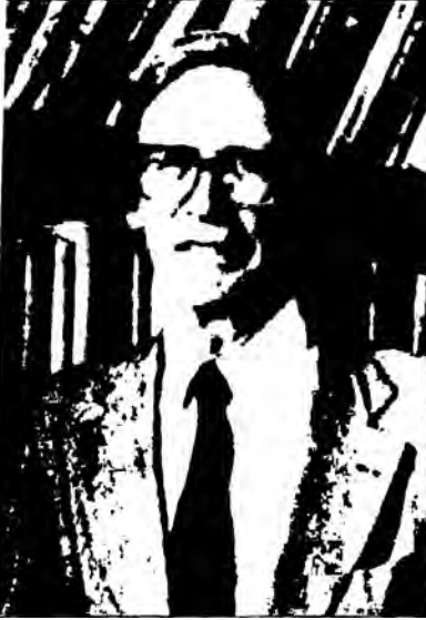
Siyaset felsefesinin canlanmasına yolaçan John Rawls (1921-2006), ABD'de doğdu. Princeton, Harvard, MIT gibi üniversitelerde siyaset felsefesi dersleri verdi. Bir Adalet Kuramı adlı kitabında eşitlik ile liberalizmi uzlaştırma çabasına katkıda bulundu.

rin kendilerini geliştirme ve gerçekleştirme hakları olduğu görüşüne dayanır ve dolayısıyla J. S. Mill'in bireyin kendi potansiyelini gerçekleştirme hakkına sahip olduğu görüşüne yakın, her türlü müdahaleyi reddeden klasik liberallerinkine ise uzaktır.