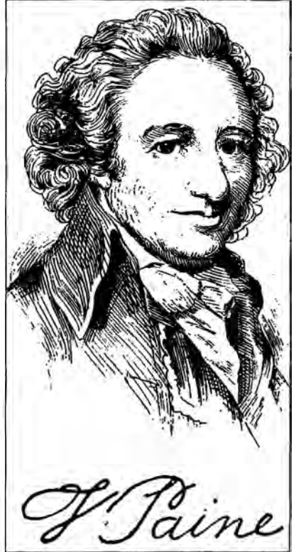
Thomas Paine (1737-1809) İngiltere’de Norfolk’da doğdu. Amerika’da bir dergide yazdığı yazılarda köleliğe ve köle ticaretine karşı çıktı. Ortak Duygu (Common Sense) adlı broşüründeki görüşleriyle Amerikan Bağımsızlık Bildirisi’ne ilham kaynağı oldu.

Daha önce de değinildiği gibi, liberal politik anlayışın temel unsurları, 1688 İngiliz “Görkemli Devrim”i, 1776 Amerikan ve 1789 Fransız devrimlerinin sonrasında oluşmuştu. En önemlisi, bu devrimlerden doğan yeni siyasal düzeni yerleştirmek için kaleme alınan çeşitli hak bildirgelerinde ve anayasalarda ifadesini bulan “hukukun üstün-