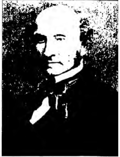
John Stuart Mill (1806-1873) Londra'da doğdu. Reformcu görüşleri savunurken özellikle bütüncü ve gelir dağılımındaki adaletsizliği dile getiren Mill, kadın hakları savunucusu olan eşi Harriet Taylor'un ölümünden sonra tamamen siyasal reformların gerçekleşmesi için çalıştı.