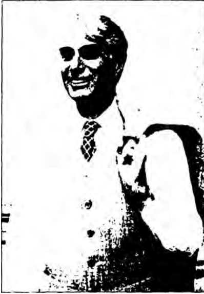
Bireyi, tarihsel ve toplumsal düzenlemelerden tümüyle soyutlayan Robert Nozick'in (1938-) mutlak bireyciliğin savunusunu yapan görüşleri, 1980'lerde siyaset bilimcileri tarafından şiddetle eleştirilmiştir.

anlamına geldiğini öne süren Nozick'e göre, piyasanın kerameti, "iyi"nin ne olduğu konusunda bir tercihte bulunmaması ve sonuçta ortaya çıkan bölüşümün bireyler arasındaki sayısız alışverişin planlanmamış sonucu olmasıdır. Hiç kimse malını ya da emeğini satmak konusunda zorlanmıyorsa ve işe girme ya da malını satma konusunda yasal engeller yoksa, liberal eşitlik ve özgürlük kısıtları gerçekleşmiş ve piyasa sistemi de adil işliyor sayılabilir. Bu işleyişin sonucu olan eşitsizliklerin, tesadüf dışında kesin bir örüntüsü yoktur. Hükümetlerin, yetişkin insanlar arasındaki kapitalist ilişki ve eylemlere müdahale hakkı bulunmamalıdır.