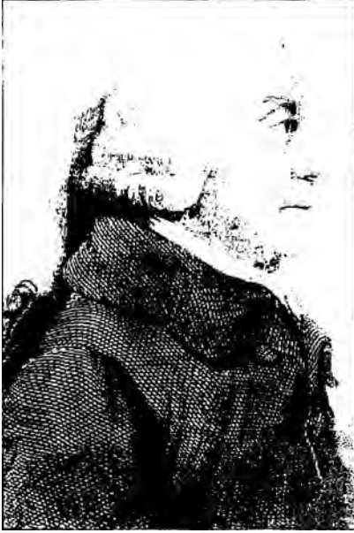
Klasik iktisadın kurucusu Adam Smith (1723-1790), toplumda bireylerin kendi dışlarında "görünmeyen bir el" tarafından yönetildiğini, bu nedenle bireylerin rekabete dayanan "hür teşebbüs"lerinin, gelişimin motoru olduğunu savundu.

verin" şeklindeydi; ya da başka bir deyişle, "bırakınız yapsınlar, bırakınız geçsinler" ( laissez faire, laissez passer ).