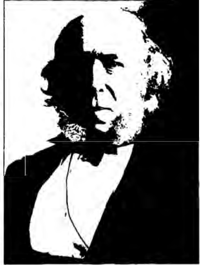
Devletin kötü ve baskıcı olduğunu, yoksulların durumunun ise kendilerinden kaynaklandığını söyleyerek reformculuğa karşı çıkan Herbert Spencer'in (1820-1903) görüşleri Durkheim dahil birçok toplumbilimciyi etkilemiştir.

için koşulların iyileştirilmesi amacıyla önerilen her türlü reforma, örneğin fabrika koşullarının sağlığa uygun hale getirilmesi, ilaç ve gıda standartları konması, zorunlu eğitim, sosyal yardım, vb. reformlara karşı çıkmasına yol açtı. Spencer'in yaklaşımının ardında, sosyal Darwinist görüşleri yatıyordu; yoksullar yeteneksiz, zayıf, basiretsiz ve tembeldi, dolayısıyla hayatta kalma mücadelesinde yenik düşmeye mahkûmdular. Bu, doğanın yasasıydı. Devlet müdahalesi her zaman zararlıydı ve doğa yasalarıyla oynanması anlamına geliyordu: "Devlet müdahalesi, ıstırabı azaltmak yerine sonuçta onu arttırır. Hayatta kalmaya hiç uygun olmayanların sayısını çoğaltır ve sonuç olarak hayatta kalmaya en uygun olanların çoğalmasını önler ve onlar için gerekli olan alanı daraltır!" Bu anlayışın izleri, 20. yüzyılın ortalarında neo-klasik liberalizmin yeni yükselişinde yer yer yankılansa da, bugün artık bu tür sosyal Darwinist iddialar kolayca öne sürülememektedir.