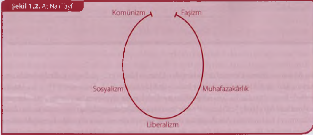
Şekil 1.2. At Nalı Tayf

ve faşist rejimler, bazılarının “totaliter” olarak betimlediği, baskıcı ve otoriter niteliği ağır basan siyasal yönetim biçimleri oluşturmuşlardır. Sonuçta alternatif bir siyasal tayf, at nalı şeklinde olabilir. Bu tayf, sağ ve soldaki uç noktaların liberalizmin, sosyalizmin ve muhafazakârlığın “demokratik” inançlarından ayrı olarak, birbirlerine yakınlaşma eğiliminde olduklarını gösterir (Şekil 1.2.).