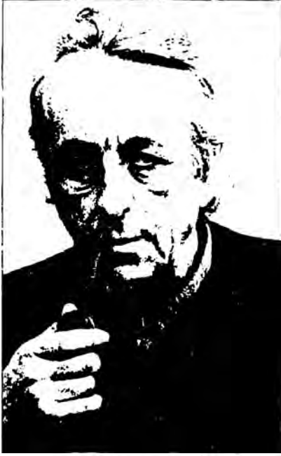
Louis Althusser (1918-1990) Cezayir'de Birmandries'te doğdu. École Normale Supérieure'de felsefe öğrenimi gördü. Özellikle 1960'tan sonra Marksist düşünce içinde gelişen eleştirel yöntemi kuramsal alanda yaptığı katkılarla zenginleştirdi.

makta, böylece sisteme başkaldırma olasılıkları azaltılmaktadır. Bu nedenle, egemen sınıfları zayıflatmanın yolu, ideolojik aygıtları ele geçirmektir.