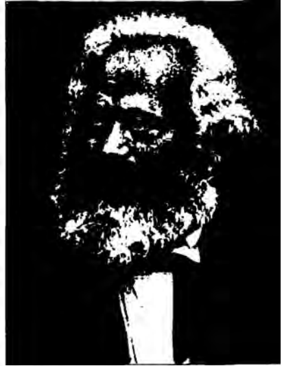
Karl Marx (1818-1883) Almanya'da Ren bölgesinde Trier kasabasında doğdu. Bonn ve Berlin üniversitelerinde hukuk öğrenimi gören Marx, düzeni eleştiren yapıtlarıyla, emekçilerin kapitalizme karşı mücadelesini sağladı.

Marx'a göre, bir üstyapı unsuru olan siyaset, altyapı tarafından, yani iktisadi örgütlenme biçimi ve ilişkileri tarafından belirlenir. 4 Emek, üretim araçları ve üretim tekniklerinden oluşan üretim güçlerinin belirli bir düzeyine, belirli tipte üretim ilişkileri (belirli bir toplumda, üretim süreci içinde bireylerin kurduğu ilişki biçimi) tekabül etmektedir. Üretim güçleri ile üretim ilişkilerinin bileşimi ise üretim tar-