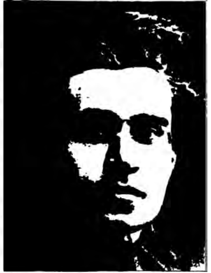
Siyasal ve sivil toplum arasında geliştirdiği ayrımın yanısıra "geleneksel aydın" ve "organik aydın" gibi kavramlarla Marksizme katkıda bulunan Antonio Gramsci (1891-1937) İtalyan Komünist Partisi'nin (PCI) kurucuları arasında yer aldı.

Gramsci'den önemli ölçüde etkilenen ve 1960'lı ve 70'li yıllarda Fransız düşüncesinin önemli bir ismi olan Louis Althusser, bir adım daha ileri giderek, ideolojiyi "sivil toplumun devletleştirilmesinin" bir aracı olarak yorumluyor. Althusser, her şeyden önce altyapı ve üstyapı arasında Marx'ın iddia ettiği gibi birebir ve katı bir ilişki olmadığını, üstyapının görece özerk olduğunu düşünüyor. Devleti ve kurumla-