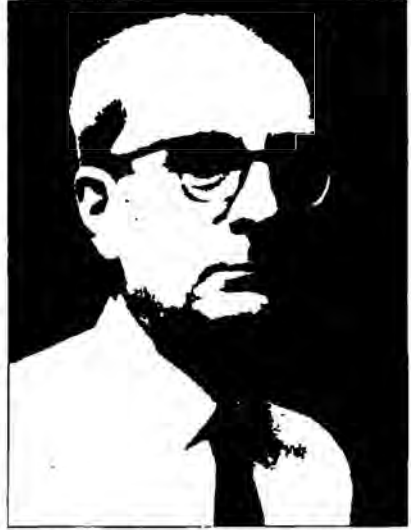
Claude Lévi-Strauss (1908-) Brüksel'de doğdu. Hukuk ve felsefe eğitimi gördü. Dilbilim üzerine çalışmaları da olan Strauss, Brezilya ve Bangladeş'te yaptığı alan çalışmalarıyla antropolojiye önemli katkılarda bulundu.

lev görmektedirler; anlaşılamayan karmaşık dünyayı anlaşılabilir kılmak. Lévi-Strauss, çağdaş Batı toplumunun yaptığı şeyin, mitosun yerine ideolojiyi getirmek olduğunu, ideolojinin bize toplumun haritasını verdiğini, toplum içinde hareket etmemizi ve yaşamamızı kolaylaştırdığını söylerken, bu noktaya dikkat çekmek istemiştir. Yine, hem mitler hem de ideolojiler, toplumun siyasal otoriteler tarafından manipüle edilmesinde kullanılan araçlar olmuşturlardır. Ancak, ideoloji mitlerden bazı farklılıklar da göstermektedir. İdeoloji, sadece grupları değil, bireyleri de derinden etkileyen, bireysel kimliğin kazanılmasına yardımcı olan, hatta bireyleri diğerlerinden “ayırır” bir özelliğe sahiptir. Yine, her ideolojinin insan doğası,