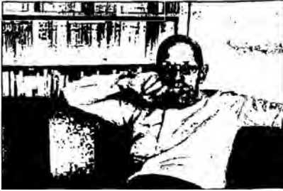
Michel Foucault (1926-1987) Fransa'da Poitiers'te doğdu, '68 hareketinden etkilendi. Hapishane, delilik, polis ve eşcinsellik üzerine yaptığı çalışmalarda iktidar ve birey ilişkilerini, modernitenin birey üzerindeki etkilerini inceledi.

kar, sınıfsal konum gibi şeyler de önceden yoktur; bunlar söylem tarafından üretilirse vardır. Bu durumda, önceden varolan öznenin nesnel çıkarlarının farkına vararak bilinçlenmesi, bu bilinci ideolojik düşünce ve ifadelere dönüştürüp mücadele ederek iktidarı ele geçirmesi mümkün değildir. Klasik görüşün, iktidarın, mücadeleyi kazanan sınıfın kendi çıkarlarını hâkim hale getirmesinin aracı olduğu yolundaki inancı yanlışır. İktidar, söylemin kendisidir ve söylem başka bir şey tarafından belirlenmez; özerktir, kendisini kendi belirler. Klasik görüşe göre, iktidar bilginin doğruluğunu çarpıtır, bu nedenle doğru ve özgür bilim imkânsızdır. Bu görüşe karşı çıkan Foucault'ya göre, iktidar ile bilgi biraradadır, iktidar olmadan bilgi üretilemez. İktidarın ne olduğu ile değil, nasıl olduğu ile ilgilenen Foucault'ya göre, iktidar yeni bilgi nesnelere ve bilgi edinme sistemleri yaratır. İktidarı devlet egemenliğinde, yasalarda, baskının örgütlenmesinde ararsak boşuna çabalayabiliriz. Bunların yerine günlük sosyal ilişkilere, cinselliğe, akrabalık ilişkilerine, kullanılan teknolojiye, ritüellere vb. bakmalıyız. Ancak o zaman, iktidarın bir programlama, bir teknik, bir strateji olduğunu anlayabiliriz. 16